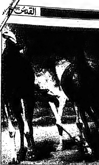
القطيع المقتله من جبال لبنان في حمران لوجي التي وصلت إليها جوارها سيواس السيوات القوي ويظهر للتصديق الفرنسي فريقه خلال جوارها الثانية في الامارات